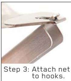
Step 3: Attach net to hooks.