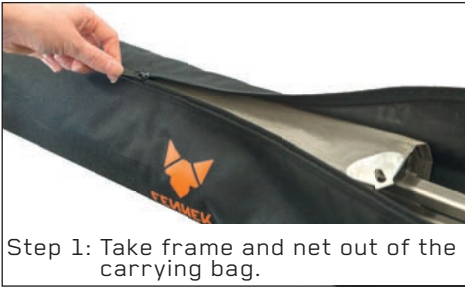
Step 1: Take frame and net out of the carrying bag.